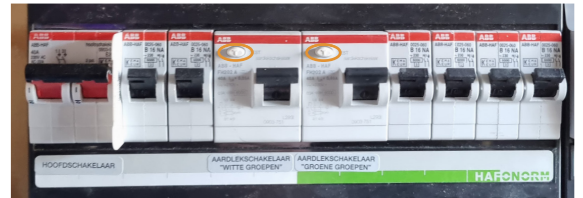
De locatie van de testknop 'T' in uw meterkast

Als een apparaat door een defect onder stroom komt te staan zorgt de aardlekschakelaar ervoor dat de stroom onmiddellijk wordt uitgeschakeld. Het is daarom belangrijk de aardlekschakelaars minimaal 1 x per maand te testen door het indrukken van de testknop T. De aardlekschakelaar dient dan direct uit te schakelen. Waarschuw uw installateur bij weigering.