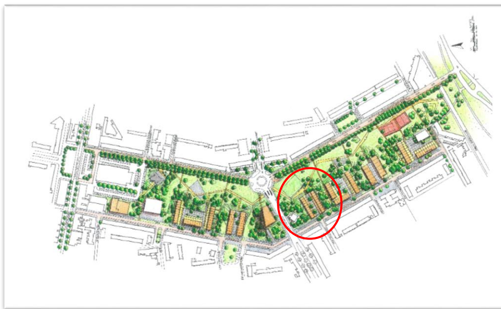
Stedenbouwkundig plan Stadspark IJmuiden; locatie nieuwbouwwoningen

Op 21 februari 2018 verleende de Gemeente Velsen een omgevingsvergunning voor de realisatie van het project. Het bouwplan bestaat uit twee evenwijdige bouwblokken van drie lagen, haaks op de Radarstraat. Tussen de blokken worden op eigen terrein parkeerplaatsen gerealiseerd. Voor de stalling van fietsen zijn op de begane grond inpandige collectieve bergingen beschikbaar. Het kleur- en materiaalgebruik van de nieuwbouw sluiten aan bij de eerder door ons gerealiseerde woningen in Stadspark.