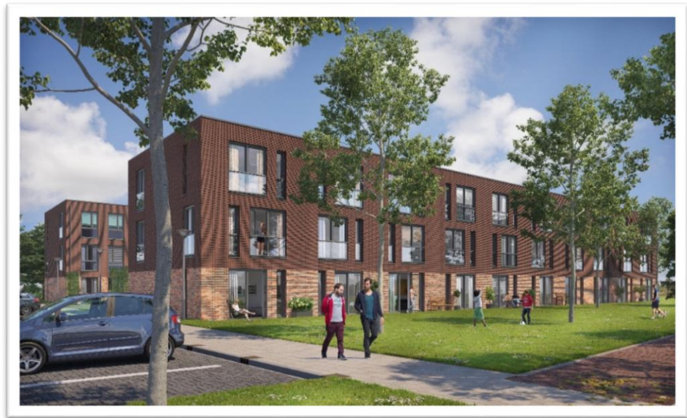
Impressie nieuwbouwplan vanaf de Radarstraat

Het is nog niet mogelijk om u in te schrijven voor de sociale huurwoningen van Velison Wonen in dit project. Zodra de oplevering van het complex in zicht komt, worden de sociale huurwoningen aangeboden via het woonruimteverdeling systeem 'Wonen in Velsen'.